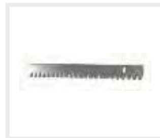
Κρεμαργιέρα - Racks

Χαλύβδινη Κρεμαργιέρα Steel spur gear racks